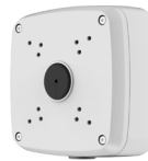
PFA121 Caja de conexiones