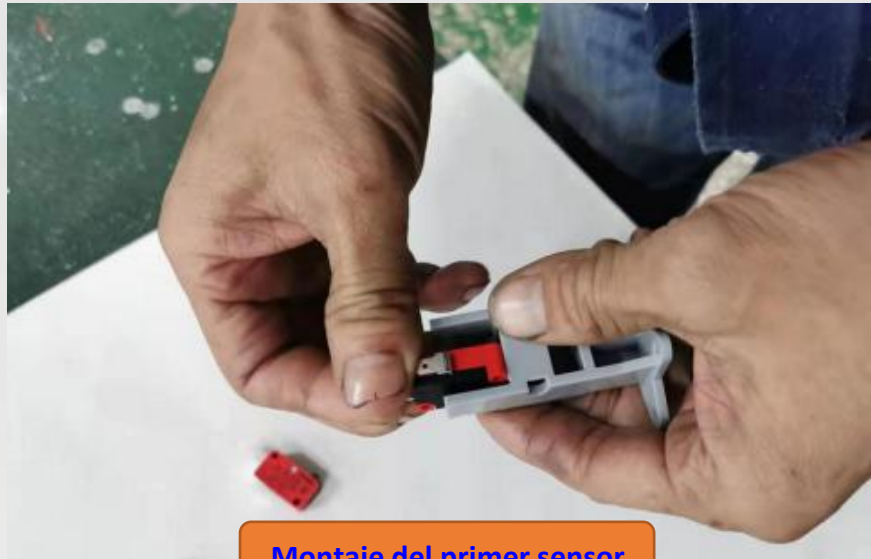
Montaje del primer sensor