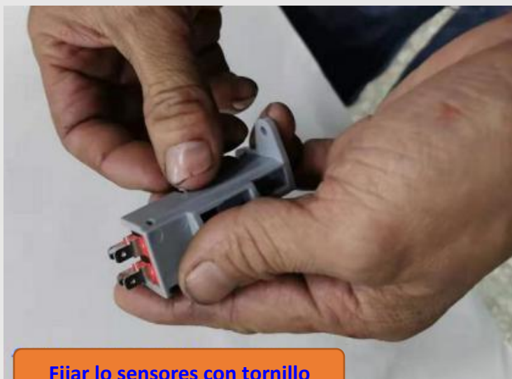
Fijar lo sensores con tornillo