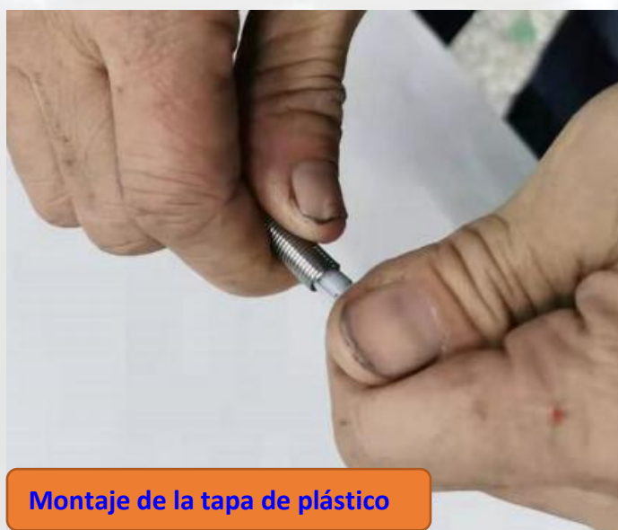
Montaje de la tapa de plástico