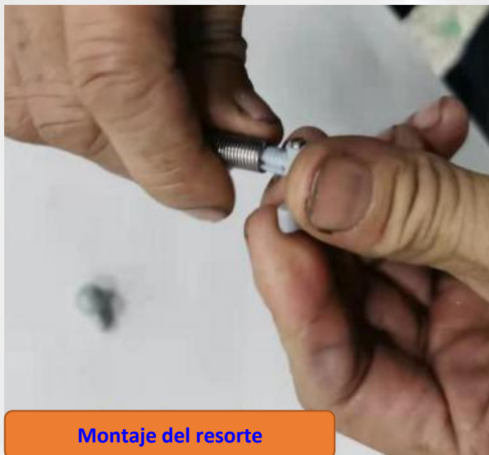
Montaje del resorte