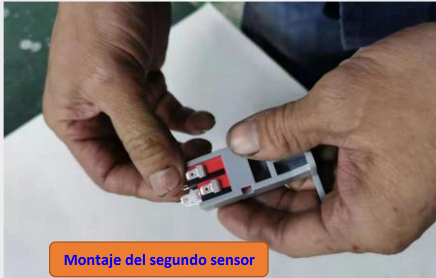
Montaje del segundo sensor