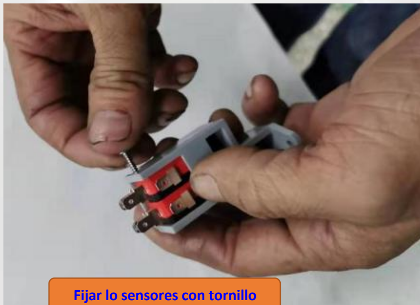
Fijar lo sensores con tornillo